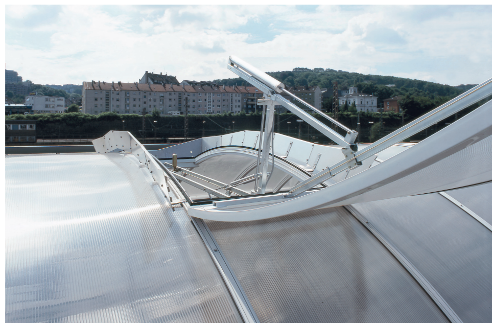
In Lichtkuppeln oder Lichtbandsegmente integrierte NRA müssen im Brandfall öffnen, um Rauch und Wärme abzuleiten.

Als elementare Bestandteile einer funktionssicheren Brandschutzkette leiten Rauch- und Wärmeabzüge im Brandfall die Brandhitze und die entstehenden giftigen Zersetzungsprodukte zuverlässig nach außen ab. Zudem unterstützen sie die Selbstrettung eingeschlossener Personen und erleichtern den Löschangriff der Feuerwehr. Voraussetzung dafür ist, dass der Brand- und Rauchschutz richtig projektiert und ausgeführt sowie instandgehalten wurde.