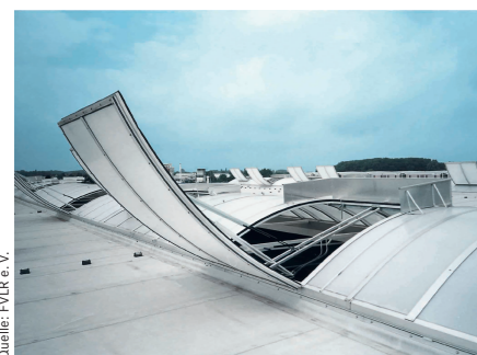
In Dachoberlichtern integrierte Rauchabzugsgeräte erfüllen die Anforderungen der Brandschutzbehörden.

Ein Brand kann verheerende Folgen haben, sowohl in Bezug auf Personen- als auch Sachschäden. Bei einem Industriebau gefährdet er möglicherweise sogar den Fortbestand des gesamten Unternehmens. Vorbeugender Brandschutz ist daher in Lager- und Produktionshallen von besonderer Bedeutung.