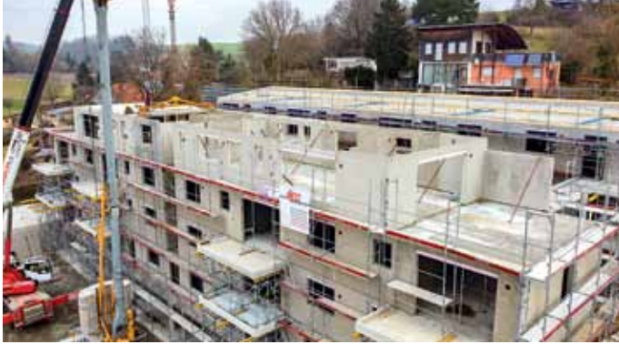
Bauzeit verkürzen und Fläche gewinnen mit vorgefertigten Betonwänden und -decken.