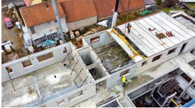
Die EPD-verifizierte DX-Fertigdecke wird durch ein flächen-deckend eingegossenes Rohrleitungssystem, in dem warmes oder kaltes Wasser zirkuliert, zu einer hocheffizienten und behaglichen Klimaanlage.