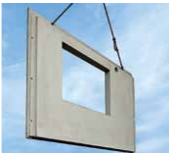
Schlanke Fertig-wand mit Fenster-aussparung

einem Heiz-/Kühlsystem ausgestattet. Mit einem integrierten System aus Alu-Verbundrohr, in dem Wasser zirkulieren kann, wird die DX-Decke zur Klimadecke. Die Räume werden mit Strahlungswärme von oben beheizt. In Kombination mit einer reversiblen Wärmepumpe kann die DX-Klimadecke im Sommer eine Klimaanlage ersetzen. KX-Wände und DX-Decke werden trocken geliefert und mittels eines speziellen Verschluss-Systems montiert. Die DX-Decke ist danach sofort belast- und begehrbar. Damit erübrigt sich eine Verschalung mitsamt Materialaufwand, Zeit und den damit verbundenen Kosten. Auch die Wände sind sofort tragfähig. Auf der Baustelle verschrauben routinierte Montageteams von Dennert Wände und Decken innerhalb weniger Stunden. Das ist Hausbau wie im Zeitraffer. Auf diese Weise ist es kein Problem, Termine einzuhalten: Selbst schlechtes Wetter kann dem Baufortschritt nichts anhaben, Termine mit Handwerkern und Installateuren lassen sich verlässlich planen.