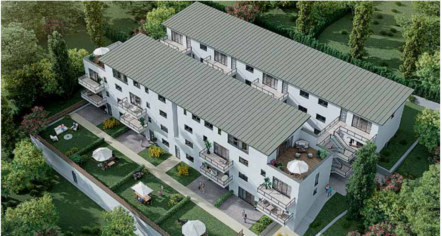
Mehrfamilienhaus in Oberfranken

Bauen in Deutschland soll schneller gehen und kostengünstiger werden. Hoch tragfähige aber trotzdem schlanke Betonfertigwände und -decken von Dennert schaffen zusätzliche Fläche und sparen Kosten, Material und CO 2 -Emissionen. Aussparungen für Fenster und Türen, Leerrohre für die Elektroinstallation oder auch integrierte Heiz- und Kühlsysteme in der Decke verkürzen Montagezeiten auch für die TGA.