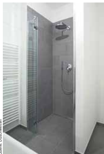
Ein komfortabler Eckeinstieg aus der Serie MK930 von Duschtrennungen