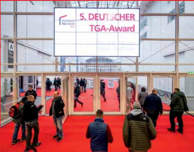
GET NORD 2022: Am Eingang Mitte wird zur Verleihung des DEUTSCHEN TGA AWARD 2022 eingeladen.