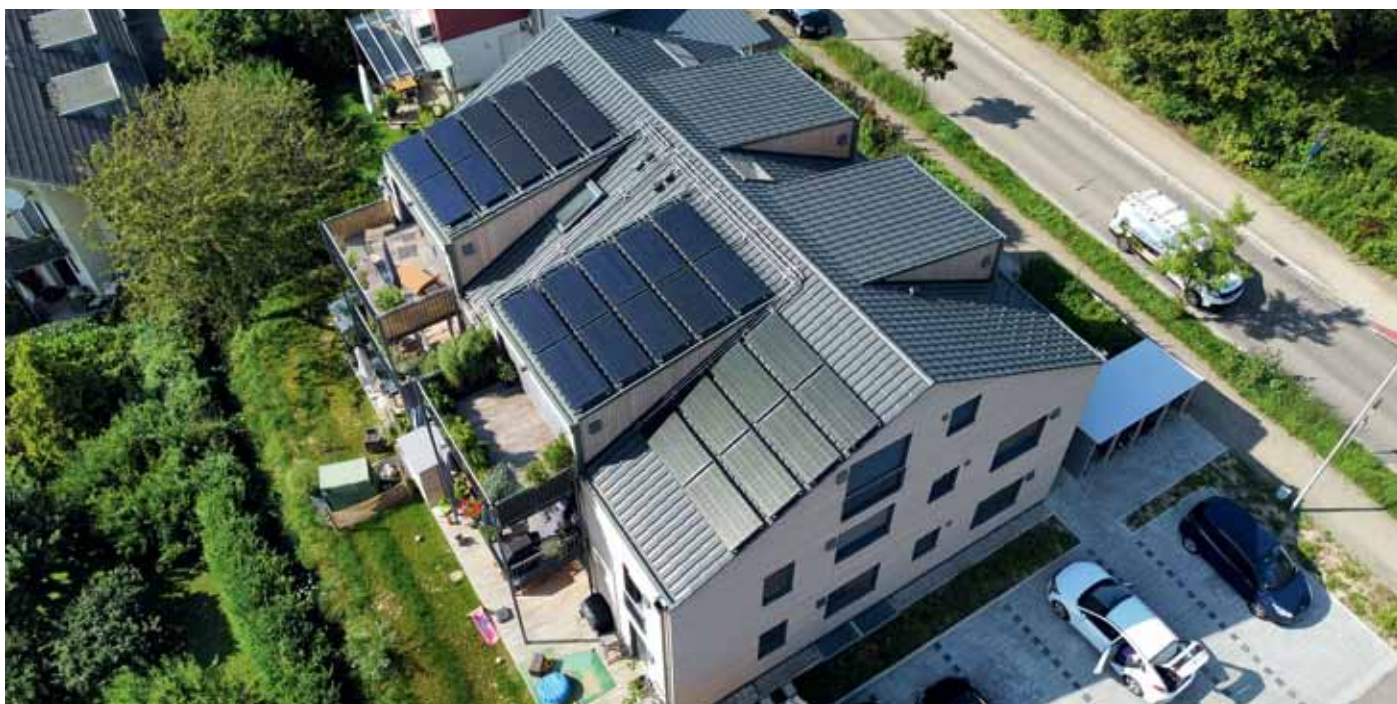
Kernsaniertes Mehrfamilienhaus beheizt mit Wärmepumpe und Solink PVT-Wärmepumpenkollektoren

Experten aus Wissenschaft, Planung, Monitoring, Entwicklung und Vertrieb von Solar- und Wärmepumpensystemen haben ein Eckpunktepapier zum „Aufbauprogramm Wärmepumpe“ des BMWK ausgearbeitet /1/. Sie sehen das Programm als eine große Chance, die jahrzehntelang verschlafene Wärmewende nun umzusetzen. Zugleich sehen sie Gefahren, falls der Ausbau nicht strategisch zielgerichtet erfolgt.