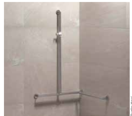
In Bestandsbädern ist es oft problematisch, mit Standardprodukten eine optimale Lösung zu erzielen. System 900 bietet z.B. maßgefertigte Halte- und Stangensysteme aus matt geschliffenem Edelstahl.

chen Morgentoilette Signale über seinen Gesundheitszustand gibt. Als Vorzeigekandidat nennt Bade u. a. den Hersteller Hewi mit einem eigenen Architektenteam, die ein Badprogramm für jung, alt und für körperlich Benachteiligte anbieten und als einer der Preisträger des Universal Design Awards 2020 ausgezeichnet wurden. Mit der „Serie 801“ brachte Hewi die erste barrierefreie Serie auf den deutschen Markt und erlangte nach eigener Aussage die Markführerschaft im Segment „Barrierefreie Sanitärausstattung“. Dabei hätten Nutzer und Pflegepersonal bei der Entwicklung gleichermaßen als „Helfer“ im Fokus gestanden. Die Raffinesse eines nachhaltigen Designkonzepts zeigt sich oft in vielen kleinen Planungsdetails. Mit dem neuen „System 900“ konnte Hewi sowohl Endverbraucher als auch Experten überzeugen und wurde in diesem Jahr gleich doppelt ausgezeichnet – mit dem Universal Design Award „consumer favorite“ und dem Universal Design Award „expert favorite“. Das System verbinde Funktionalität sowie ausge-