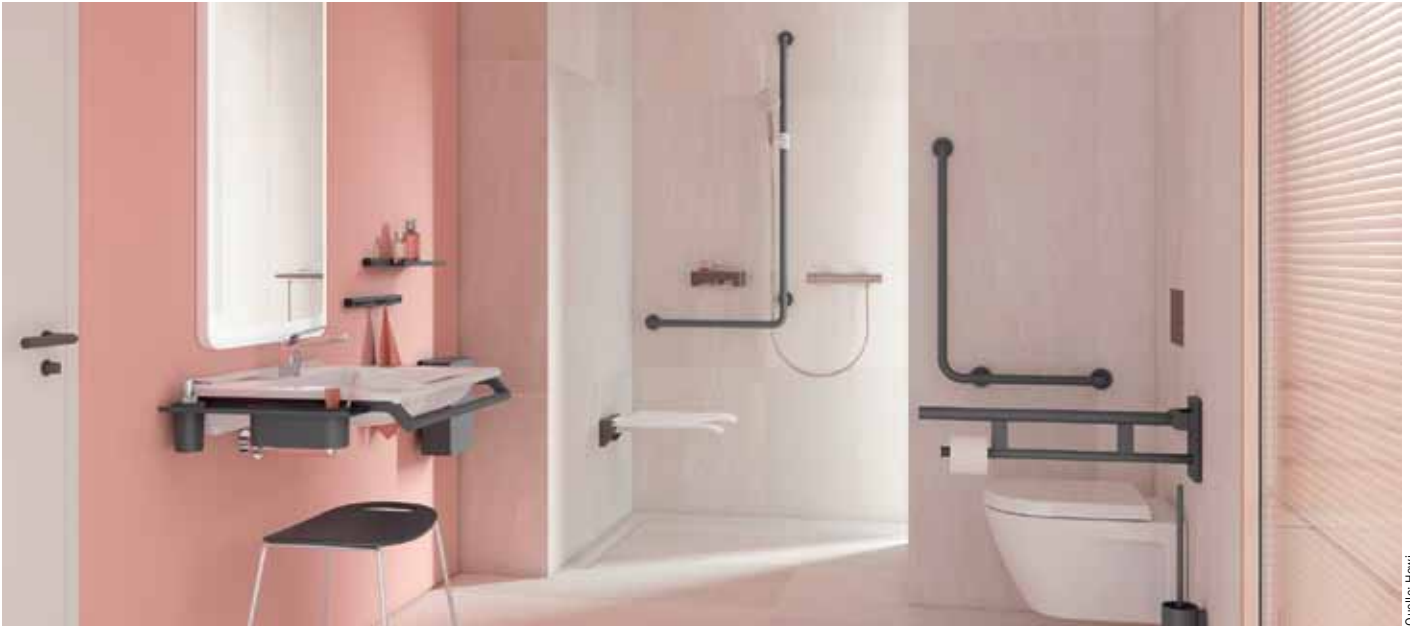
Das barrierefreie Architektursystem „S900“ von Hewi soll durch Funktionalität, dauerhafte Qualität, clevere Montagetechnik und hygienische Gestaltung überzeugen. Das puristische Design ist an verschiedenste Gebäudetypen und Anwendergruppen angepasst, sei es im Krankenhaus oder in der Seniorenresidenz, in öffentlichen Gebäuden, im Hotel oder auch zu Hause.

Universelles Design ist ein internationales Designkonzept, mit dem Produkte, Geräte, Umgebungen und Systeme derart gestaltet werden, dass sie für so viele Menschen wie möglich ohne weitere Anpassung oder Spezialisierung nutzbar sind. Dies ist vor allem in der Sanitärwirtschaft ein wichtiger Faktor.