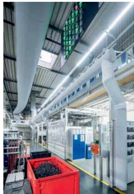
Die Schichtlüftung sorgt für frische Luft in den Produktionsbereichen.

Der Arbeitsauftrag war dabei klar formuliert. Das bestehende maschinelle Be- und natürliche Entlüftungssystem sollte überarbeitet werden, um so vor allem für die Mitarbeiter, aber auch für die Produktionsmaschinen adäquate klimatische Arbeitsbedingungen zu schaffen. Dabei sollten die Klima-Experten von Colt International immer auch die Betriebsbedingungen, hygienischen Anforderungen und die wirtschaftlichen Bedingungen für den Fertigungsprozess und seine zukünftigen Anforderungen sicherstellen. Und nicht zuletzt war es auch ein erklärtes Ziel, den Energieverbrauch und den CO 2 -Ausstoß auf ein Minimum zu reduzieren. Das entlastet das Klima und spart zugleich Betriebskosten.