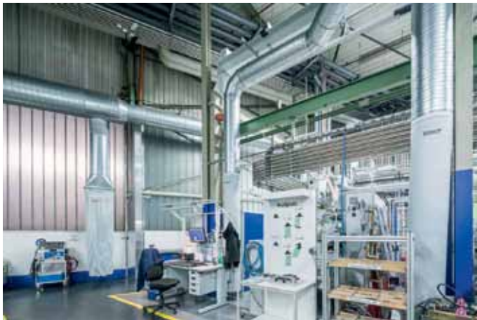
Das Colt Lüftungssystem schafft adäquate klimatische Arbeitsbedingungen für Mitarbeiter und Produktionsmaschinen.

Hohe Temperaturen sind in der Spritzgießfertigung der Kunststoffindustrie in Verbindung mit den bereits vorhandenen Prozesstemperaturen ein großes Problem. Besonders im Sommer sorgen die hohen Außentemperaturen für ein sehr unangenehmes Klima. Das erschwert die Arbeit der Beschäftigten, setzt der Elektronik der Maschinen zu und kann die Prozesssicherheit gefährden. Abhilfe schafft die richtige Klimatechnik, die auf die jeweiligen Anforderungen des Betriebs abgestimmt sein sollte.