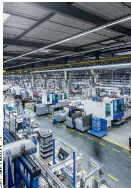
Adiabatische Kühlung und Schichtlüftung als Lösung für die hohen Temperaturen der Spritzgießfertigung